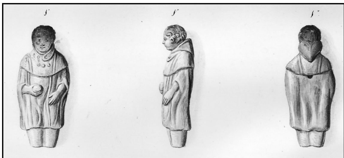
Eén van de vondsten op het grondgebied van Pervijze

In de terrein-depressies worden zoetwater-moerassen gevormd waardoor de weelderige flora het laag- en hoogveen doen ontstaan. Hierop ontstaan over een groot deel van Vlaanderen, onder andere ook op het grondgebied van onze gemeente, moerassige bossen. Tijdens de vierde eeuw voor Christus begint de Duinkerke I transgressie die met woeste overstromingen een groot deel van de oude duinen opruimt, voornamelijk aan de oostkust. Aan de westkust is er enkel een relatief kleine doorbraak te Wulpen nabij Veurne. Tot maximaal 7 km achter de huidige kustlijn werden afzettingen gevonden. Pervijze bleef gevrijwaard.