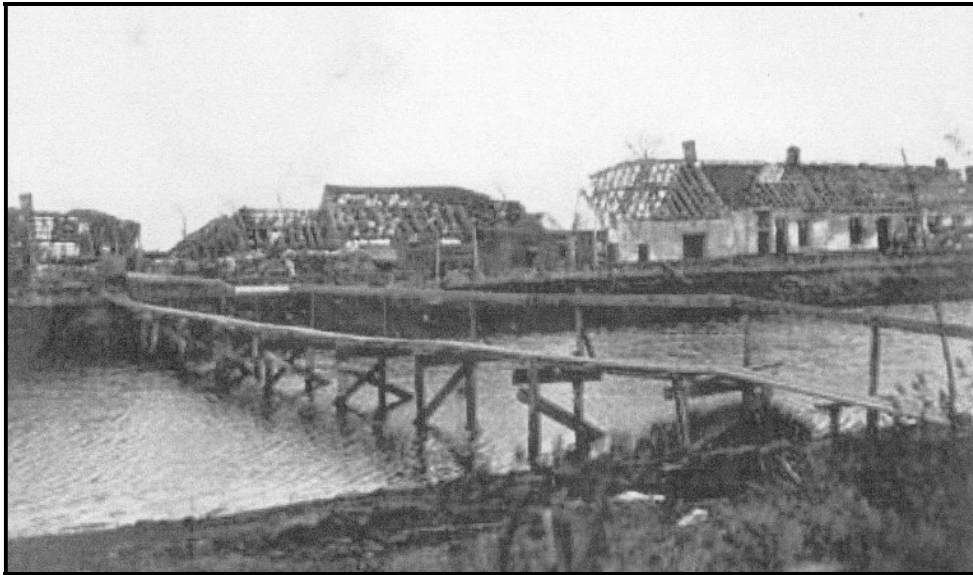
Dezelfde huizenrij tijdens de oorlog – Duitse foto

De voorspoed wordt echter een halt toegeroepen door de oorlog die opnieuw uitbreekt. Weeral maakt Schoorbakke de oorlogsmisericie van zeer dichtbij mee.